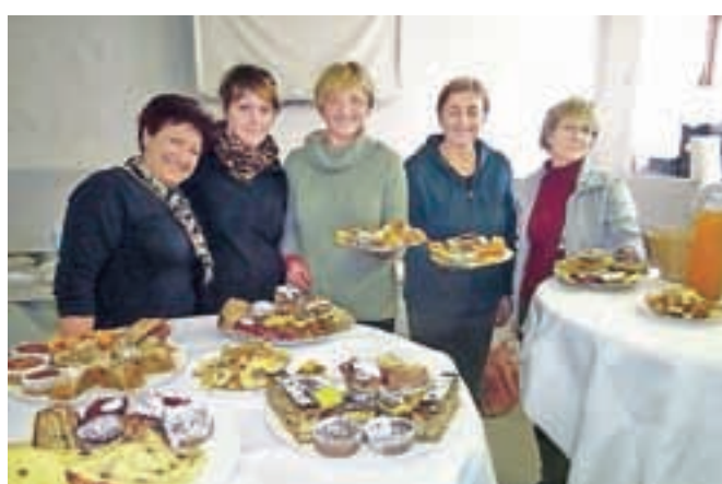
Članice Društva podeželskih žena Kamnik-Komenda s sladkimi jabolčnimi dobrotami

Gora pri Komendi – No, morda prav toliko res ne, a članice Društva podeželskih žena Kamnik-Komenda so dokazale, da se iz jabolka lahko speče, skuha in kako drugače pripravi zelo veliko jedi. Na Koželjevi domačiji na Gori pri Komendi so pred dnevi namreč pripravile razstavo približno tridesetih sort jabolka in številne jabolčne jedi, med katerimi so mnoge že skorajda pozabljene. Največ je bilo različnih sladkic, od jabolčnega zavitka, palačink z jabolčno marmelado, jabolčne potice, različnih pit pa vse do pečenih jabolka, nadevanih s kostanjevo kremo. Razstavile so tudi jabolčno juho, hren z jabolki, prekmaš, čaj iz posušenih jabolčnih olupkov, jabolčne krljle, čežano, pa kis, sok, mošt. Članice društva so na razstavo povabile tudi Valentina Zabavnika, predsednika Sadjarsko-vrtnarskega društva Tunjice, ki je med drugim poudaril pomen ohranjanja starih sadnih sort in velik potencial, ki ga imamo na tem področju. J. P.