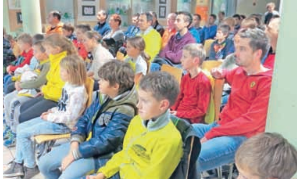
Avla OŠ Stranje je bila ob slovesnem zaključku sezona polna tekačev vseh starostnih kategorij.

Tekači KGT Papež so bili tudi reprezentanti na evropskem prvenstvu v gorskih tekih, kjer sta 5. mesto dosegla Čuferjeva in Kosovelj, sedem tekačev pa je suvereno nastopilo tudi na svetovnem prvenstvu. Nad vse uspešen pa je bil nastop na SP v gorskem maratonu v Ameriki, k ekipnemu bronu