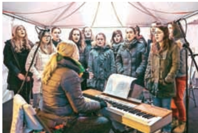
Za praznično vzdušje na odprtju je poskrbel tudi Pevski zbor OŠ Toma Brejca.