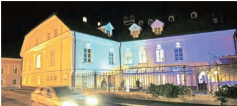
Malograjski dvor znova sprejema goste.