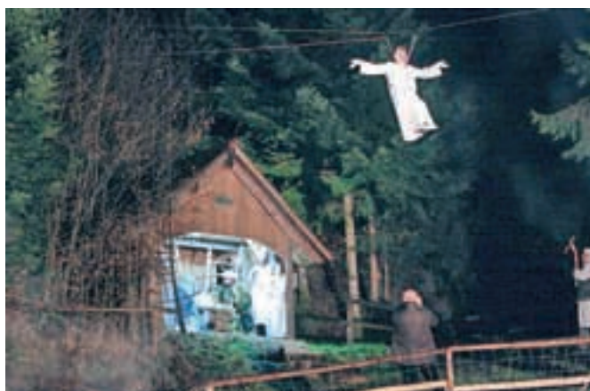
Vrhunec predstave se je odvil v hlevčku, za navdušenje gledalcev pa je poskrbel tudi prihod angela.

Da je bil večer res pravo predbožično doživetje, so organizatorji poskrbeli tudi z živimi živalmi, v predstavi pa je sicer sodelovalo več kot osemdeset članov turističnega, kulturnega in konjerejskega društva ter ljubiteljev Tuhinjske doline.