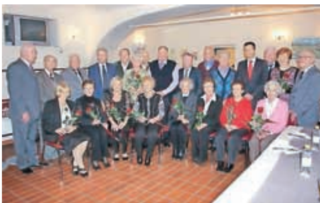
Člani DU Kamnik, ki so v letošnjem letu praznovali zlato poroko in so se udeležili praznovanja v društvenih prostorih.