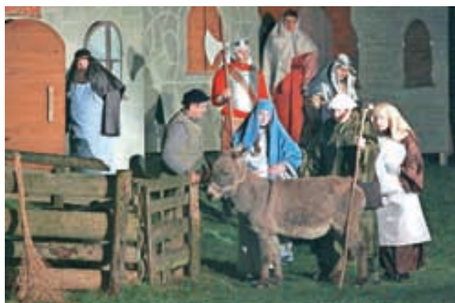
Igralci so pričarali tudi vzdušje v Betlehemu izpred dva tisoč let, ko sta Jožef in Marija iskala prenočišče.