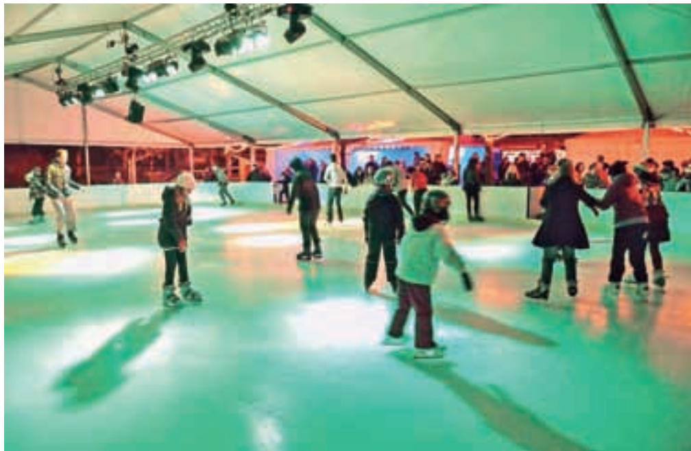
Pokrito dršališče so tudi letos prvi navdušeno preizkusili najmlajši.